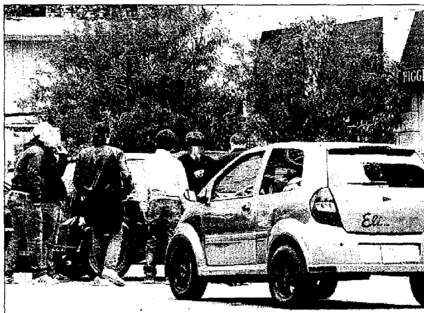
Minicar, due giovani morti a Roma in 48 ore. Nel tondo, il ministro Altero Matteoli